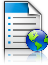
Forms and Favorites

Display Customization: Visualice una presentación personalizada con desplazamiento en la pantalla táctil a color para comunicar mensajes importantes a usuarios mientras la impresora está en modo de Ahorro de Energía.